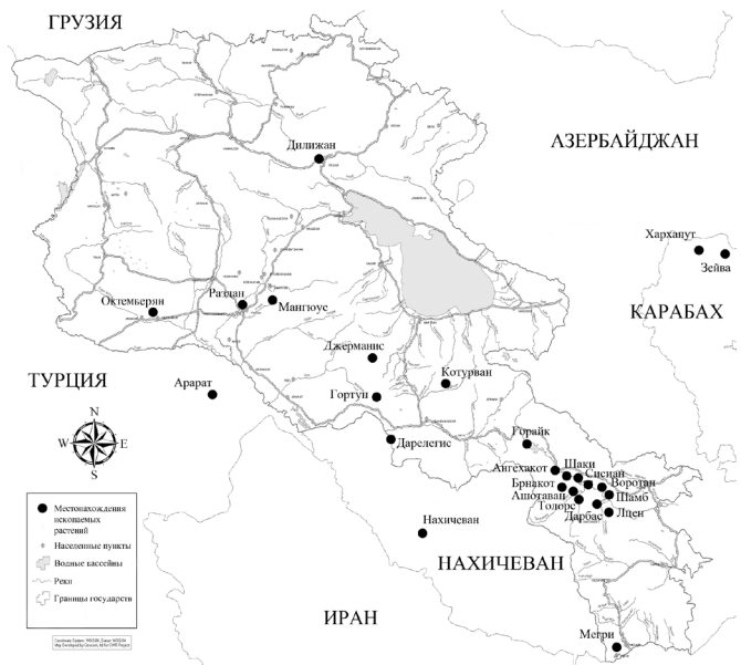
Карта 1. Местонахождения ископаемых растений на территории Армении, Нагорного Карабаха и Нахичевана